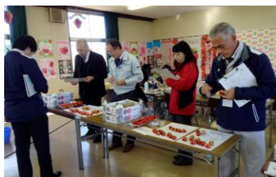
審査委員による品質審査

今後、2月21日(水)・22日(木)の2日間で圃場審査を実施し、4月の第2回品質審査、6月の収量審査を経て、最終審査会でグランプリを決定します。