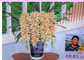
1/19 シンビジウム 松島 清文氏(鹿沼市)