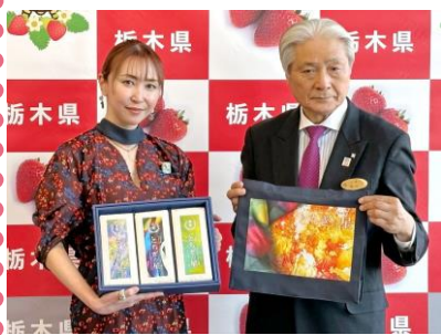
(右)栃木県知事 福田 富一氏 (左)西形 彩氏

今後、「とちぎの星」プロモーションを展開し、イメージアップ及び認知度向上並びに利用促進を図っていきます。