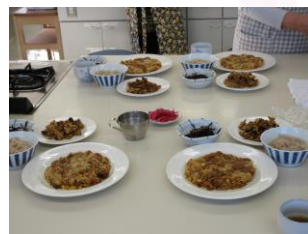
出来上がった料理