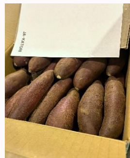
輸向けM級さつまいも

今後、今回の事例等を参考にし、関係機関等と連携しながら、本県における「さつまいも」の輸出可能性について、引き続き検討を進めます。