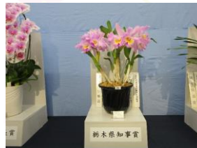
栃木県知事賞のカトレア