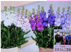
1/12 ストック 室井 和文氏ご家族(那須町)