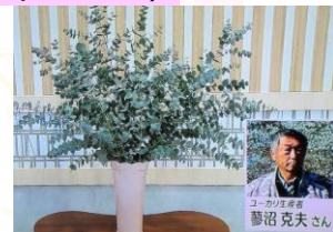
1/26 ユーカリ 菱沼 克夫氏(足利市)